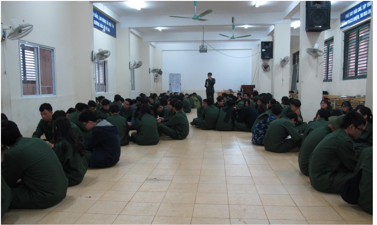
Học sinh chăm chú theo dõi trong buổi học