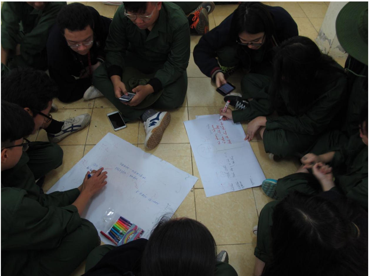
Hoạt động Thấu hiểu bản thân với chủ đề “Phòng chống bạo lực học đường”