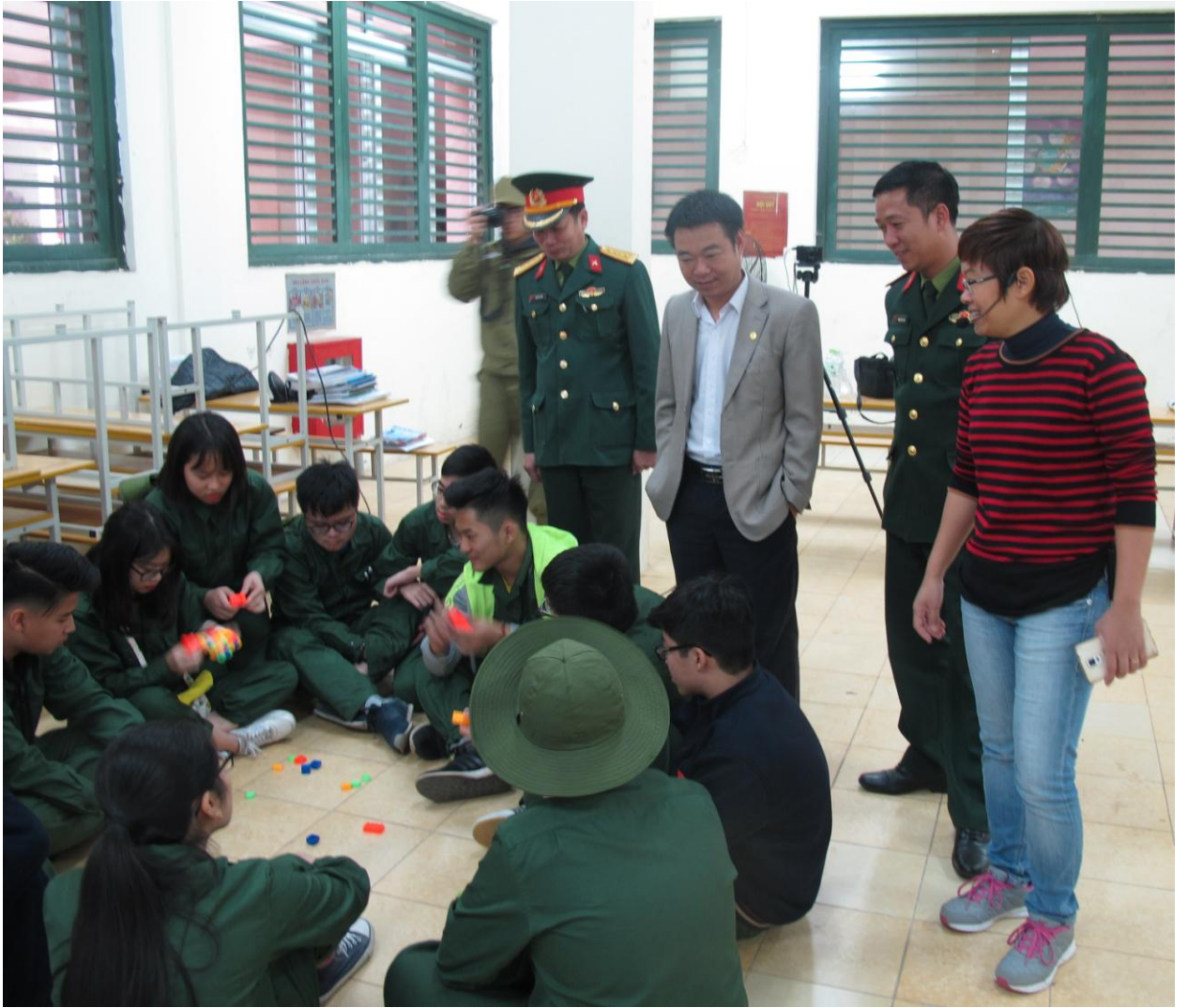
Tham gia trò chơi khởi động "Trí nhớ siêu đẳng"