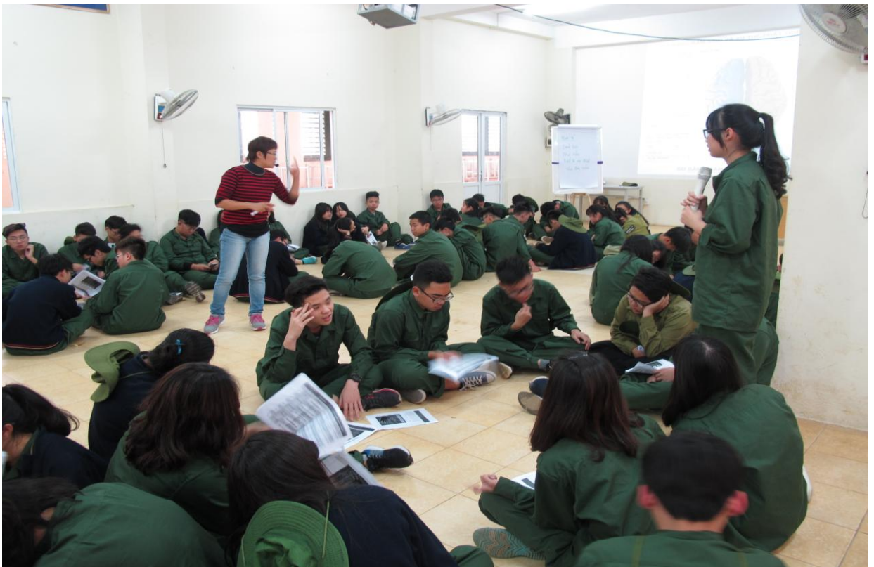
Chuyên gia chia sẻ cách ứng dụng vân tay trong việc phát hiện những đặc điểm bẩm sinh của mỗi người