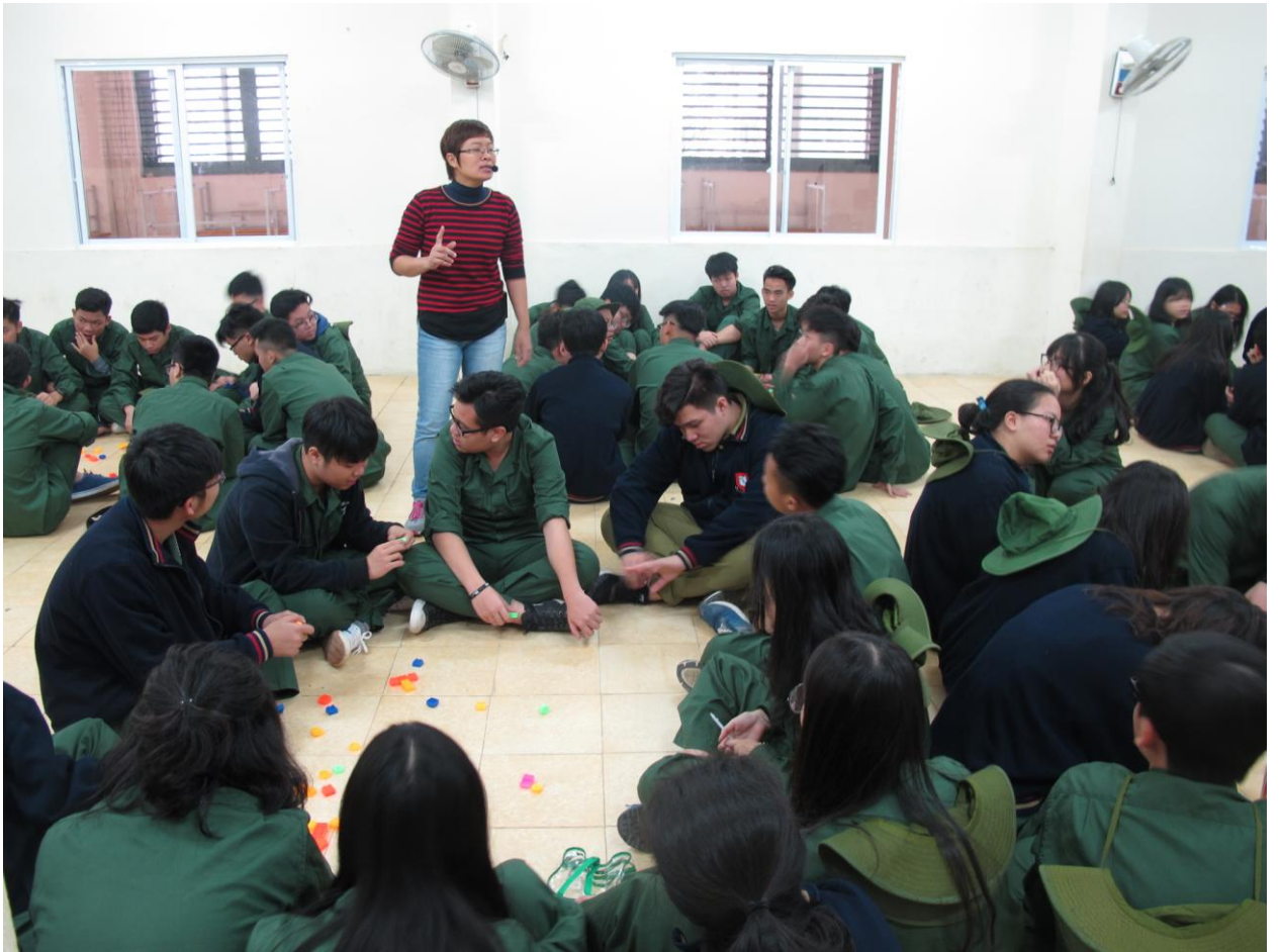
Học sinh được chia làm các tổ tham gia trò chơi